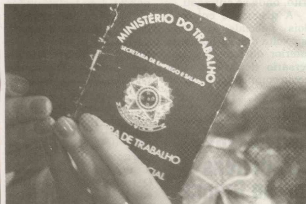
Entre os serviços oferecidos na unidade móvel do Poupatempo, o munícipe pode contar com a emissão de carteira de trabalho

A Unidade Itinerante do Governo de SP registrou quase duas mil solicitações de RG, 723 emissões de Carteiras de Trabalho, 250 acessos ao e-poupatempo e 120 expedições de Atestado de Antecedentes Criminais. Além da emissão de pouco mais de três mil unidades do CPF, serviço que foi oferecido pela primeira vez, no Poupatempo Móvel de Guarujá, em conjunto com os Correios.