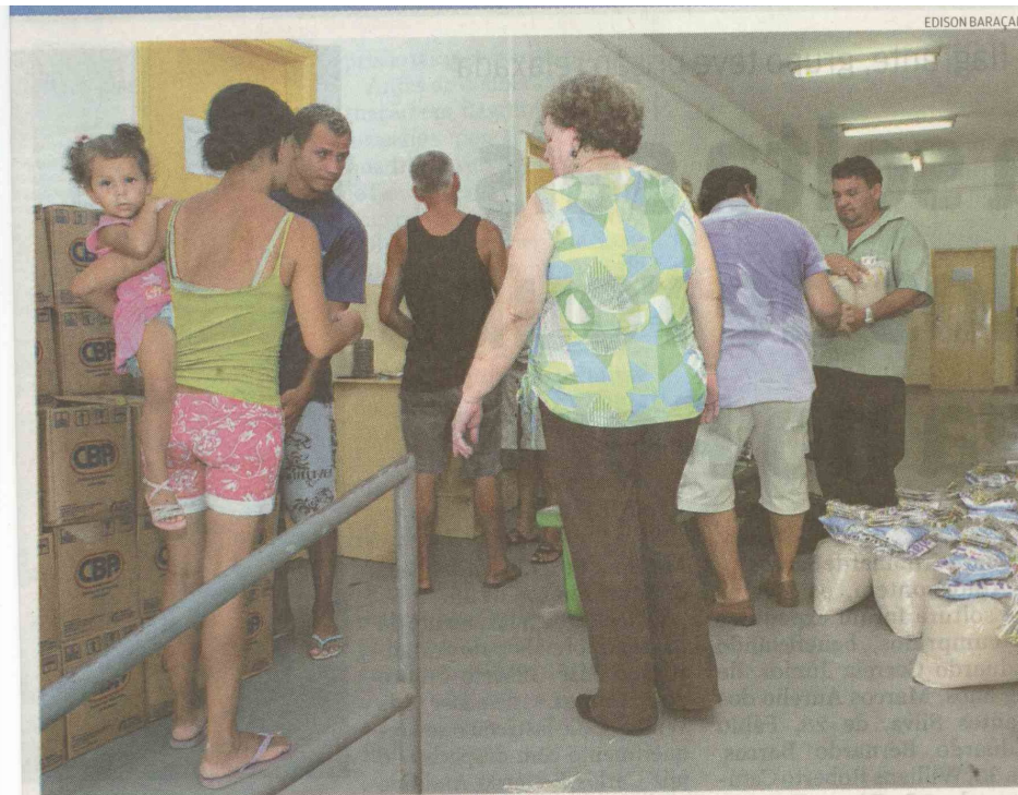
Famílias cadastradas também recebem cesta básica. Prefeitura calcula que fogo deixou 300 desabrigados